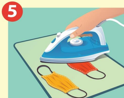
Planche las máscaras de tela si es necesario para mantener su forma.

Seque las máscaras completamente. Para secarlas, póngalas en la secadora. O utilice un secador de pelo y manténgalo a una distancia mínima de 6-8 pulgadas del filtro durante el proceso. O colgarlas y dejar que se sequen al aire bajo la luz solar indirecta.